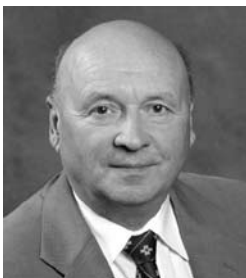
Ю.П. ПОХОЛКОВ, президент Ассоциации инженерного образования России:

Предлагаю ввести понятие территориальных каникул для вузов, оказавшихся в состоянии «start up» в новых условиях. И через определенное время, которое будет определено министерством, посмотреть, на что они выйдут. Конечно, если они за это время не смогут оправдать доверия экспертного сообщества, государства и гражданского общества, тогда уже, что называется, они получат то, что заслужили.