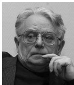
В.Д. ШАДРИКОВ, академик РАО, заслуженный работник высшей школы Российской Федерации, директор Института содержания образования:

То, что мы пытаемся сейчас создавать, это давно создано в таких странах, как Великобритания, Канада, Япония, Соединенные Штаты — двухступенчатая система гарантий качества. Первая ступень — общественно-профессиональная аккредитация и вторая ступень — сертификация и регистрация профессиональных инженеров.